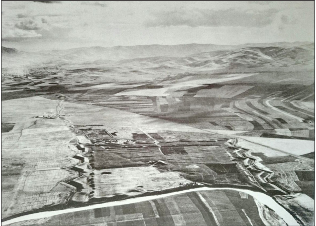
تصویر ۱. عکس هوایی قلعه کهنه کرمانشاه که توسط اشمیت انداخته شده است (مأخذ: اسمیت، ۱۳۷۶).

اند، مهندسان ایرانی نیز نقشه‌های فراوانی از آثار و ابنیه تاریخی ایران فراهم کرده اند که فهرست آن خود تدوین رساله‌ای را می‌طلبد.